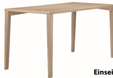
Einseitig konifizierte Tischbeine: unterstreichen das zurückgenommene, leichte Design.

Vierfüßtische im geradlinigen Design ergänzen die Serie perfekt. Zur Auswahl stehen verschiedene Profile mit geraden und konifizierten Tischbeinen. Platte und Tischbeine sind durch eingelassene Anschraubplatten oder abgeschrägte Zargen verbunden.