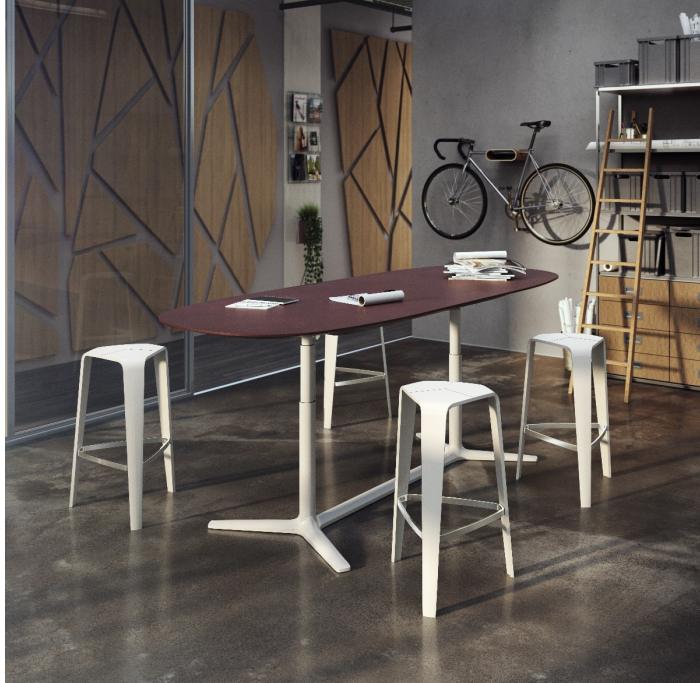
BRUNNER | LIFT