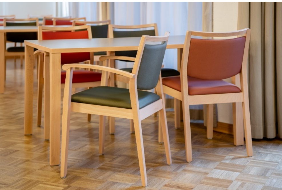
BRUNNER | BUENA NOVA. CLEAR