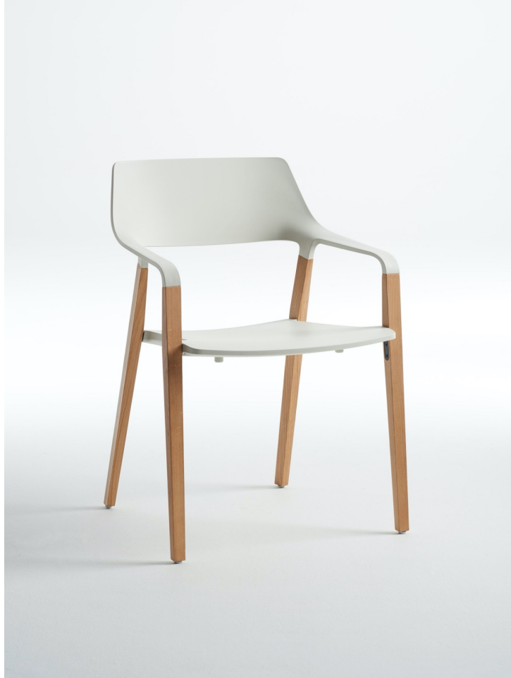
BRUNNER | HALM