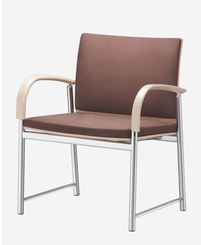
BRUNNER | JUMP