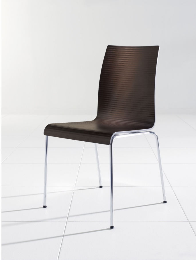
BRUNNER | PRIME