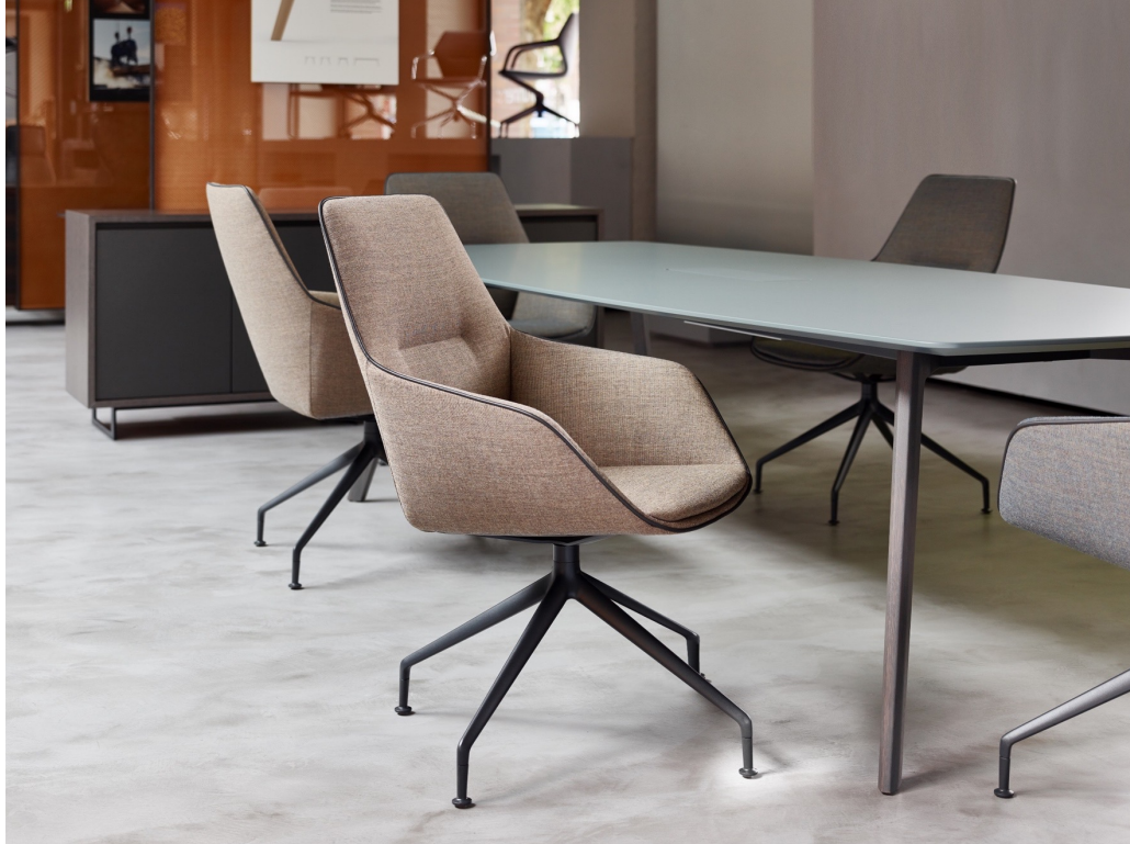
BRUNNER | RAY SOFT