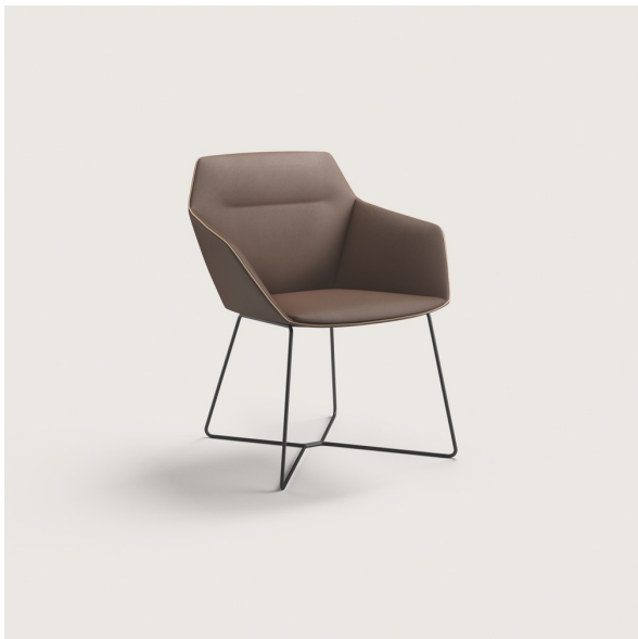
BRUNNER | RAY SOFT