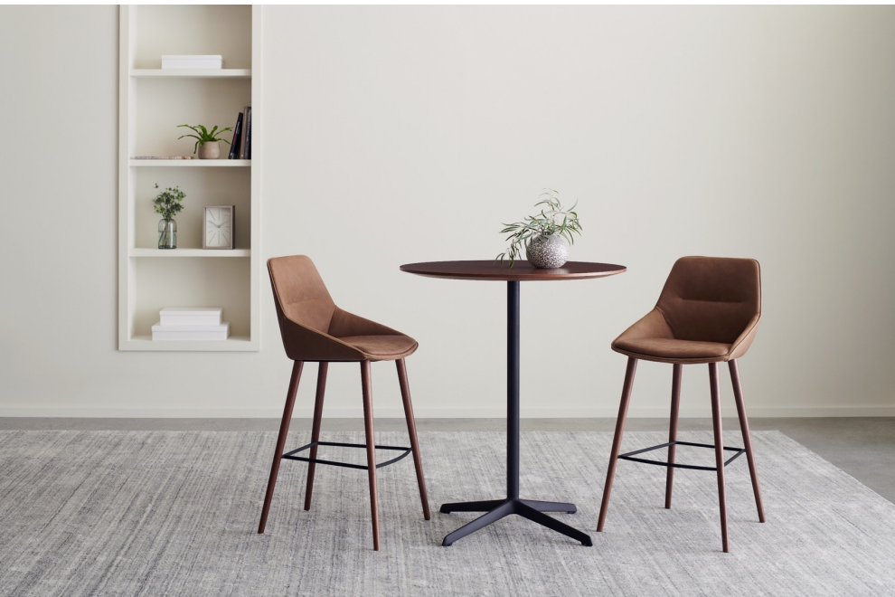
BRUNNER | RAY SOFT