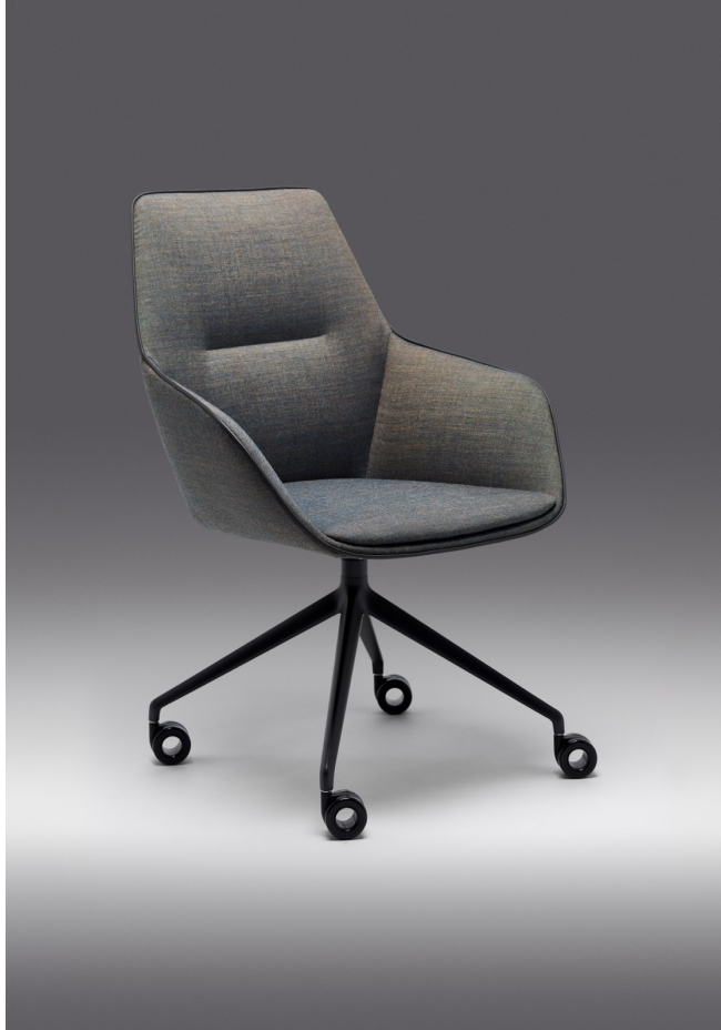
BRUNNER | RAY SOFT